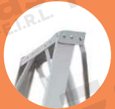
Base superior de aluminio