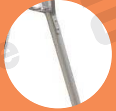
Barra tubular de aluminio